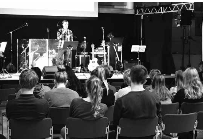
Nyårsläger i Karleby