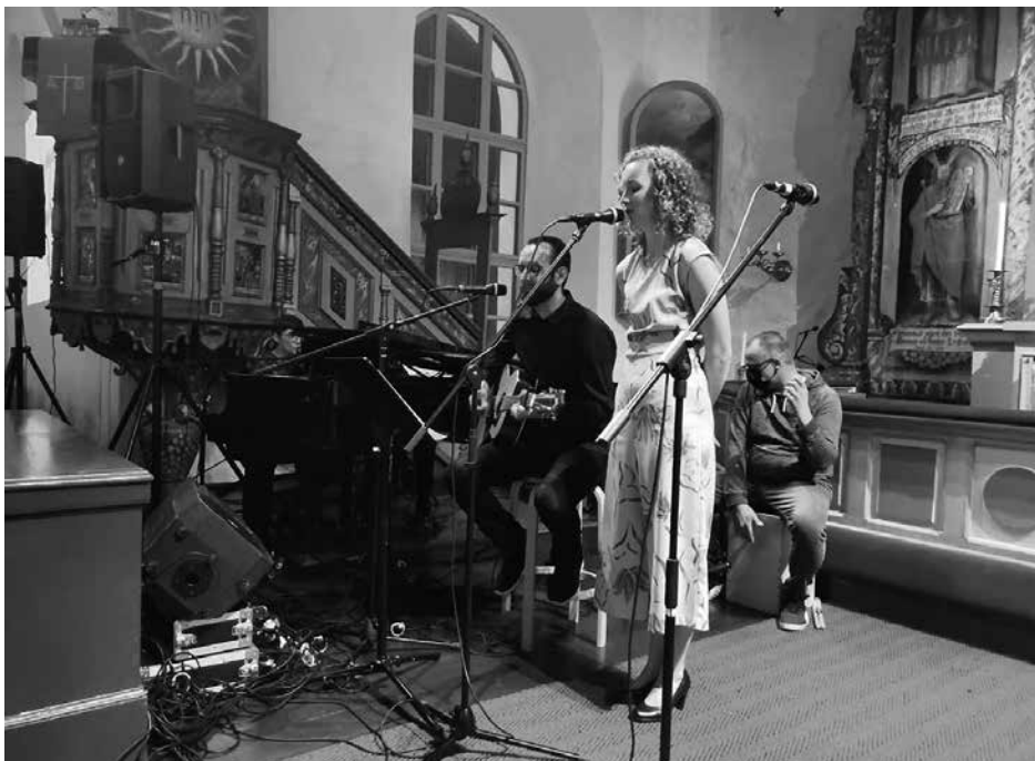
Sång- och musikprogram på 100-årsjubileet i Karleby.

Styrelsen har under året haft elva sammanträden: 30.1, 13.2, 19.2 (via e-post), 17.3, 15.4 (via Zoom), 29.4 (via Zoom), 19.5 (via Zoom), 15.8, 10.9, 24.10 samt 7.11.