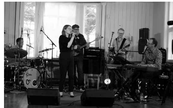
Midsummer på Pörkenäs

16.5 Unga vuxna helg på Pörkenäs, "Kingdom come". Genomfördes som en virtuell strömmad samling. Medverkande på plats: Jakob Backlund och medlemmar från nätverket Frontline. Inbandad undervisning med Jakob Edman och Alaric Mård . Deltagare: Ca 40 personer i realtid. I samarbete med nätverket Frontline Jeppis.